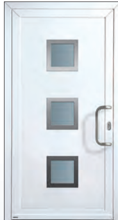
51 294 k € 1.852,-