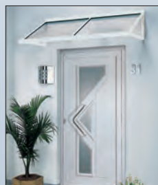
49 801 € 912,- Vordach