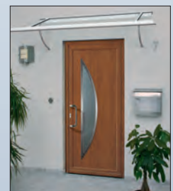
49 858 € 759,- Vordach

Wir freuen uns, Sie persönlich beraten zu dürfen: