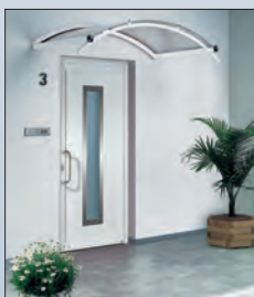
49 803 € 1.084,- Vordach

Einladend präsentieren sich Haustüren mit passendem Vordach! Die perfekte Ergänzung für Ihren Eingangsbereich.