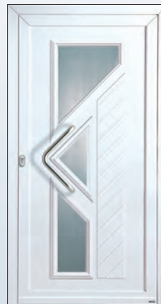
51 562 € 2.129,-

Mit VSG-Wärmeschutzverglasung U_g = 1,1 \text{ W/m}^2\text{K} für noch mehr Heizkostenersparnis. Außer Modell: 51564 k