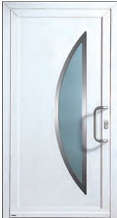
51 566 k € 1.899,-

Aktions-Angebot vom 01.09.2011 bis 31.03.2012