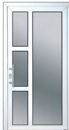
51 865 k € 1.746,-