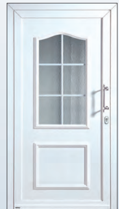
51 564 k € 2.063,-

Die angegebenen Preise können je nach Ausstattung variieren. Abbildungen teilweise mit mehrpreispflichtigen Sonderausstattungen. Preise inkl. MwSt.