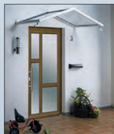
49 802 € 813,- Vordach