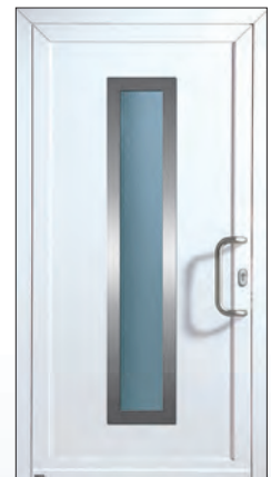
51 572 k € 1.683,-

Serienmäßig mit selbstverriegelndem Mehrriegelschloss Weru-AutoLock!