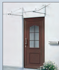
49 568 € 650,- Vordach