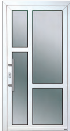
51 912 k € 1.799,-